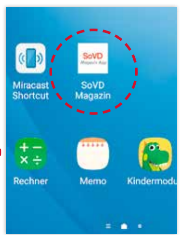
Das Logo erscheint neben den bereits installierten Apps.