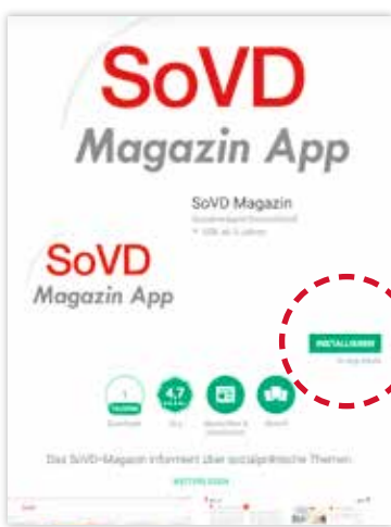
Dann die App auswählen und auf „Installieren“ klicken.