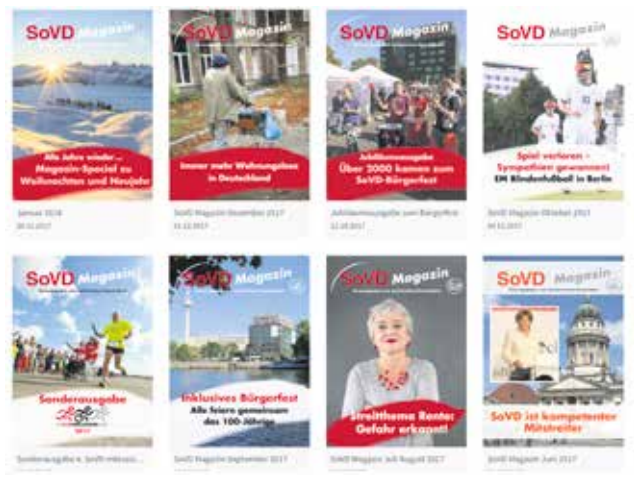
Oben der Link, wie er auf www.sovd.de steht, die untere Reihe zeigt den Kiosk mit allen verfügbaren Ausgaben.