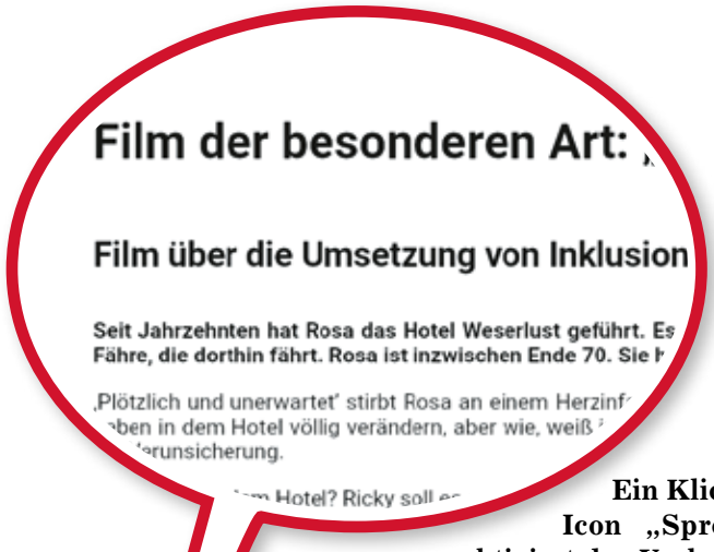
Ein Klick auf das Icon „Sprechblase“ aktiviert den Vorlesemodus.

In Ergänzung zur gedruckten Zeitung „Soziales im Blick“ erscheint monatlich ein Online-Magazin, das auch als App verfügbar ist. Zudem gibt es Sonderausgaben wie zuletzt zum Bürgerfest. Das Interesse ist groß, innerhalb weniger Tage wurden die Inhalte zehntausendfach aufgerufen.