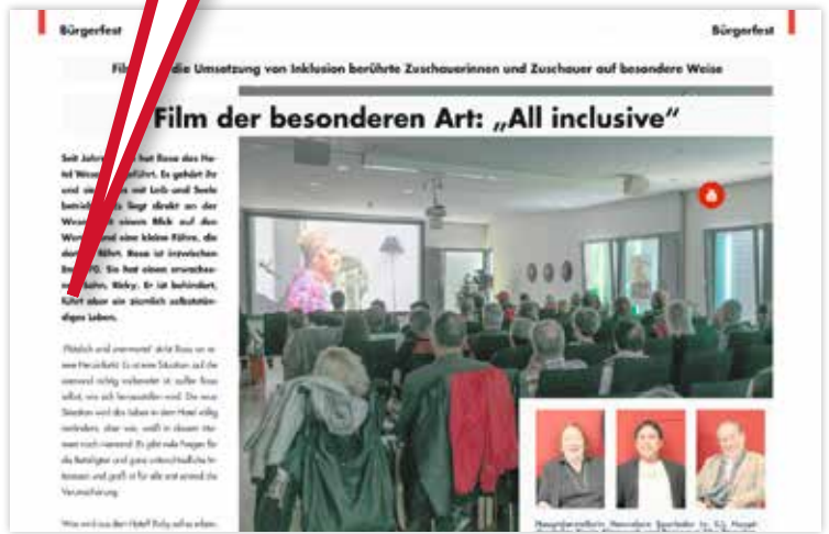
Das rote Widget mit dem Youtube-Logo zeigt an, dass sich dahinter ein Video zum Thema verbirgt.

Seit Anfang 2017 gibt es das Online-Magazin der SoVD-Zeitung als kostenlose App für Tablets und Smartphones sowie zur Ansicht am PC. Im Magazin werden die Themen aus der Zeitung in aufgelockelter Form mit zusätzlichen Bildern und Informationen medial aufbereitet.