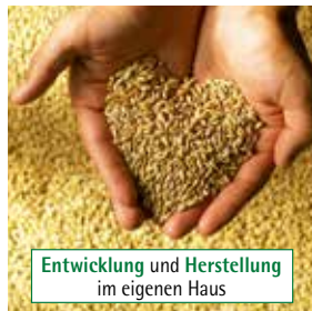
Entwicklung und Herstellung im eigenen Haus