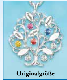
Abbildung mit nur vier Namen und vier Steinen (so bleiben drei der sieben Steine weiß)