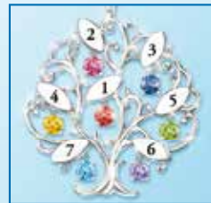
In dieser Reihenfolge werden Ihre Namen auf das Schmuckstück graviert

Die Familie ist wie ein starker Baum, den nichts erschüttern kann. Tragen Sie diesen symbolischen Familienbaum immer bei sich: mit dem Schmuck-Anhänger „Familie der Liebe“.