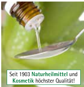
Seit 1903 Naturheilmittel und Kosmetik höchster Qualität!