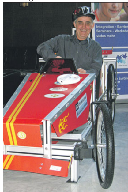
Die Besucher konnten die integ-Seifenkiste ausprobieren.

ren. „Die Erreichbarkeit der Praxis, ein barrierefreier Zugang sowie Treppen im Gebäude betreffen Menschen mit Behinderungen und vorübergehenden gesundheitlichen Einschränkungen, aber auch Ältere und Eltern mit kleinen Kindern“, betont Bauer. Der SoVD Niedersachsen gibt die Fragebögen an Mitglieder und Interessierte ab. Sie können direkt beim Landesverband angefordert werden (E-Mail: bernd.dyko@sovd-nds.de, Tel. 0511/70148-72).