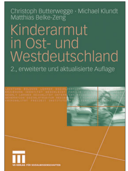
Das Buch erschien 2008 in aktualisierter Auflage.