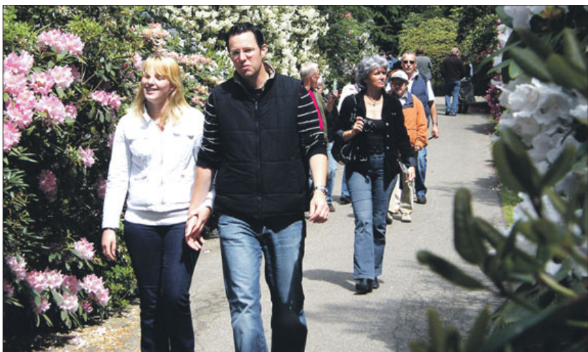
Inmitten farbenfroher Rhododendren führt ein 2,5 Kilometer langer Rundweg durch den Park.

Der Rhododendronpark in Westerstede zählt nicht nur zu den größten Parks dieser Art in Deutschland, sondern auch zu den schönsten in ganz Europa. Seit Beginn des Jahres gehört der Park nun zu den Kooperationspartnern des SoVD Niedersachsen.