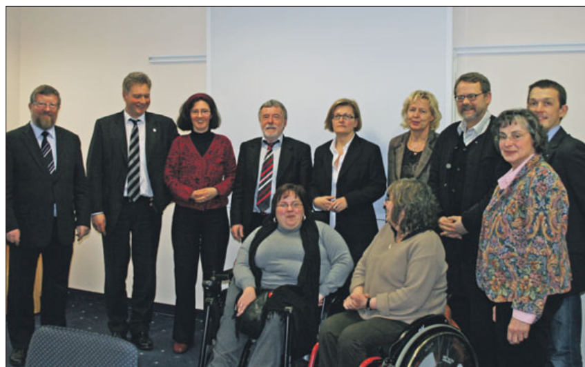
Experten diskutierten mit dem SoVD Niedersachsen ausführlich Konzepte, wie behinderte und nichtbehinderte Kinder im niedersächsischen Bildungssystem gemeinsam lernen können.